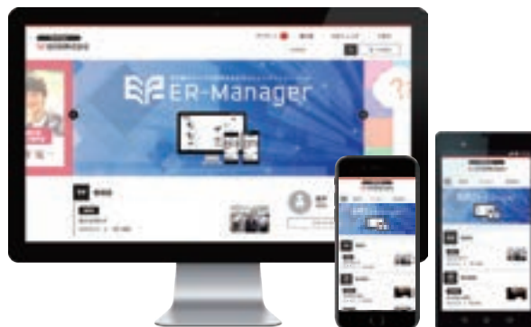
社内コミュニケーション支援システム「ER-Manager」

2019年5月期においては、このような様々な取り組みをグループ一体となって収益に結びつけ、お客様の多様なニーズにお応えすることで、「新・中期経営計画2020」で掲げた目標の達成へ向けてさらなる成長を実現してまいります。